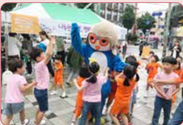
사회복지의 날 기념 미니박람회