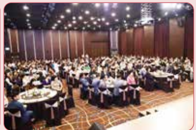
사회복지의 날 기념 민·관소통워크숍