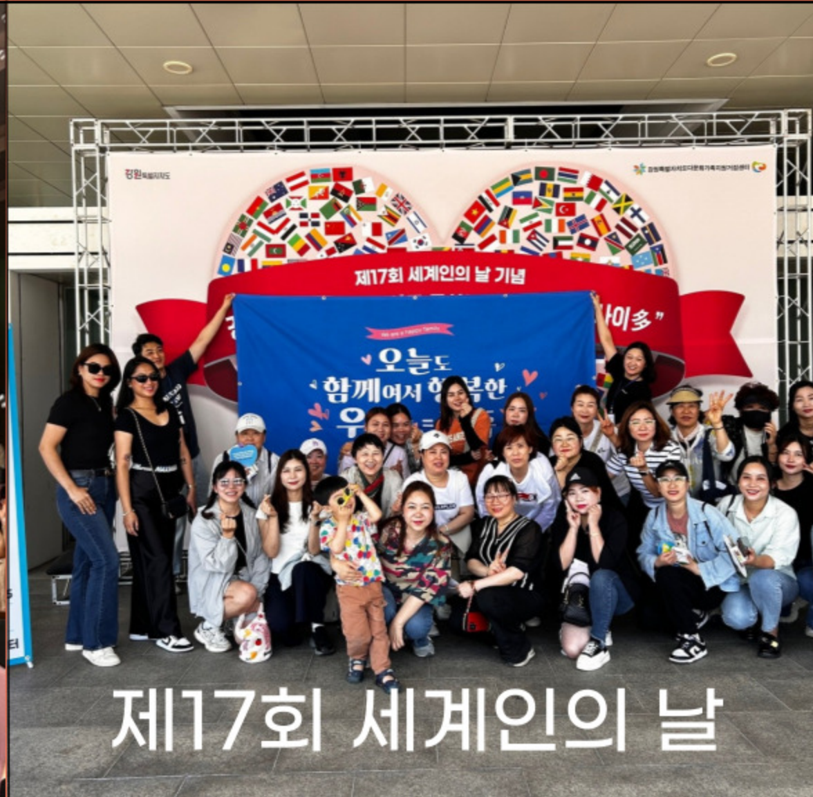
제17회 세계인의 날

일시 : 24년 5월 22일(수) 내용 : 매직 버블쇼 공연 관람 대상 : 춘천시민 100명 장소 : 강원대학교 미래도서관 정강홀