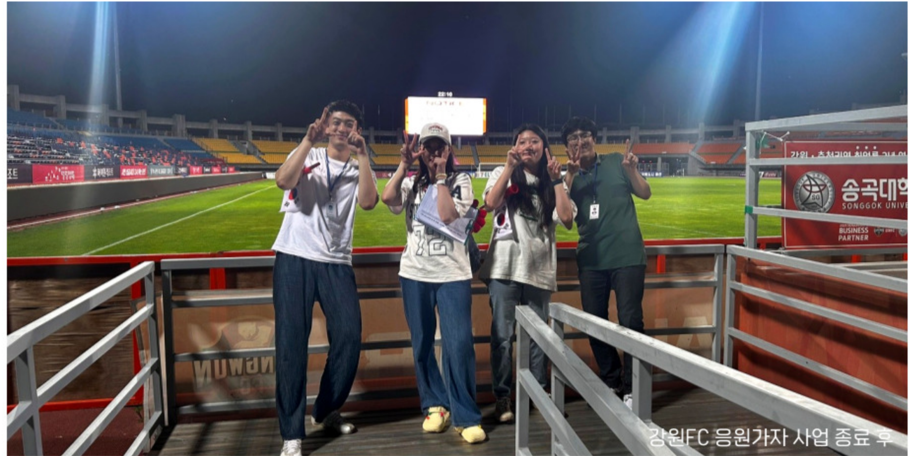
강원FC 응원가자 사업 종료 후