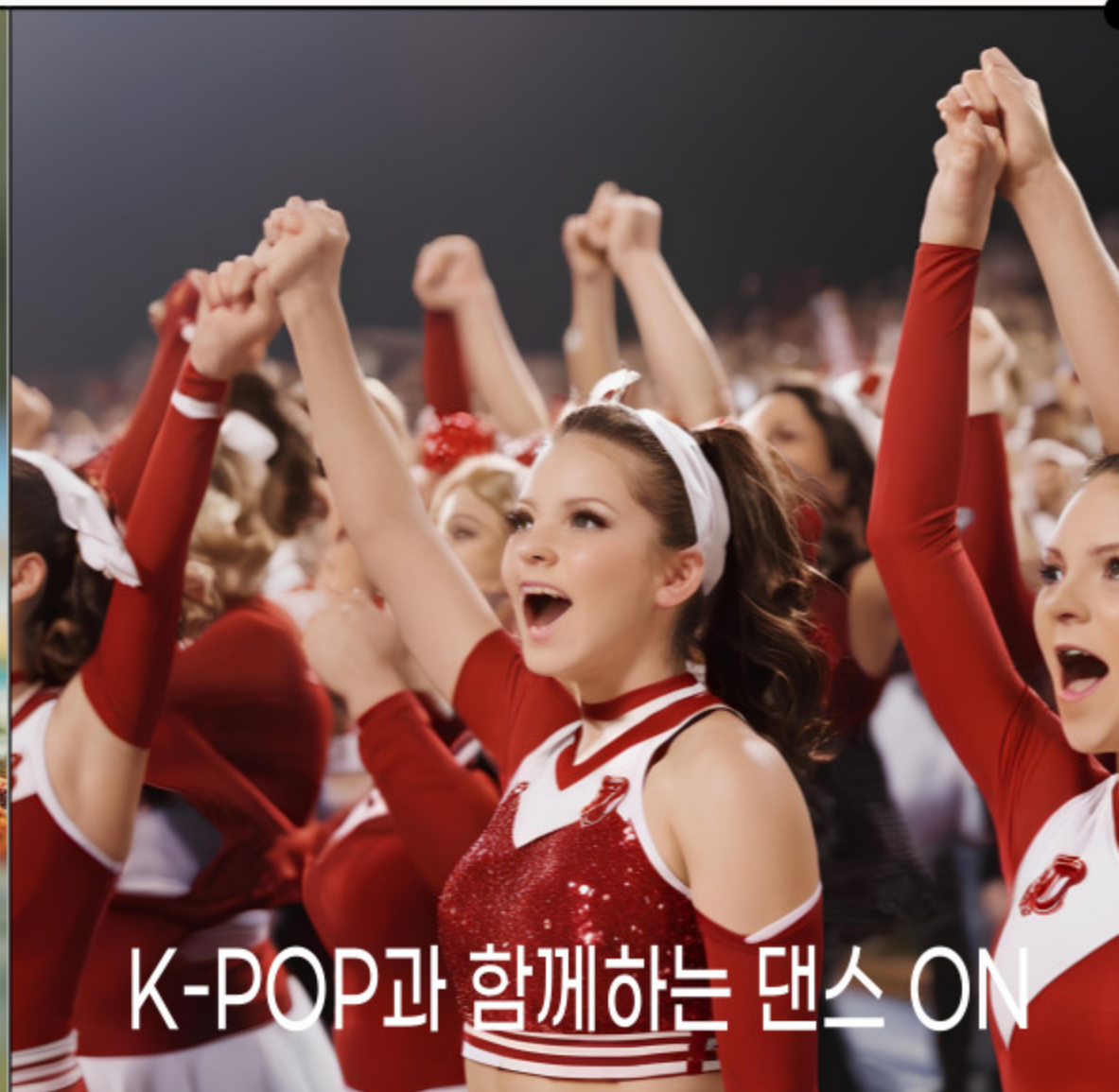
K-POP과 함께하는 댄스 ON

일시 : 24년 7월 26일~8월 9일(3회) 10시~12시 내용 : 생애주기별 재무목표, 내집 마련 체크 등 대상 : 다문화가족 부모 15명 장소 : 센터 6층 1교육실