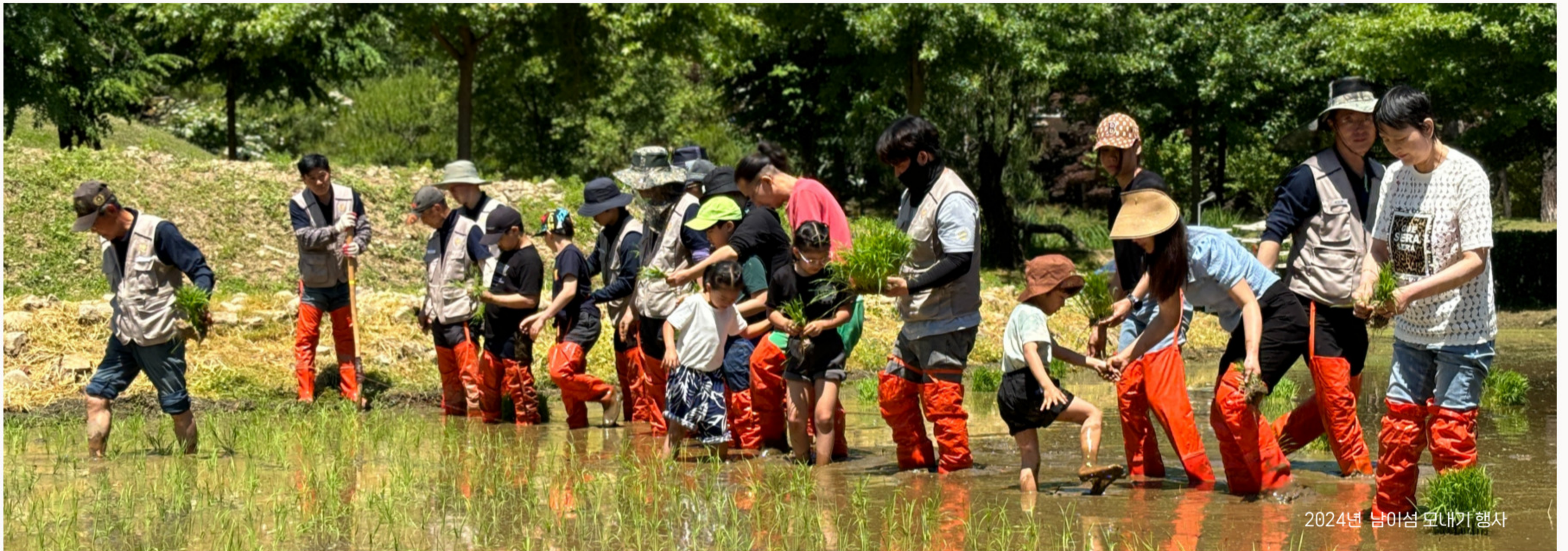
2024년 남이섬 모내기 행사